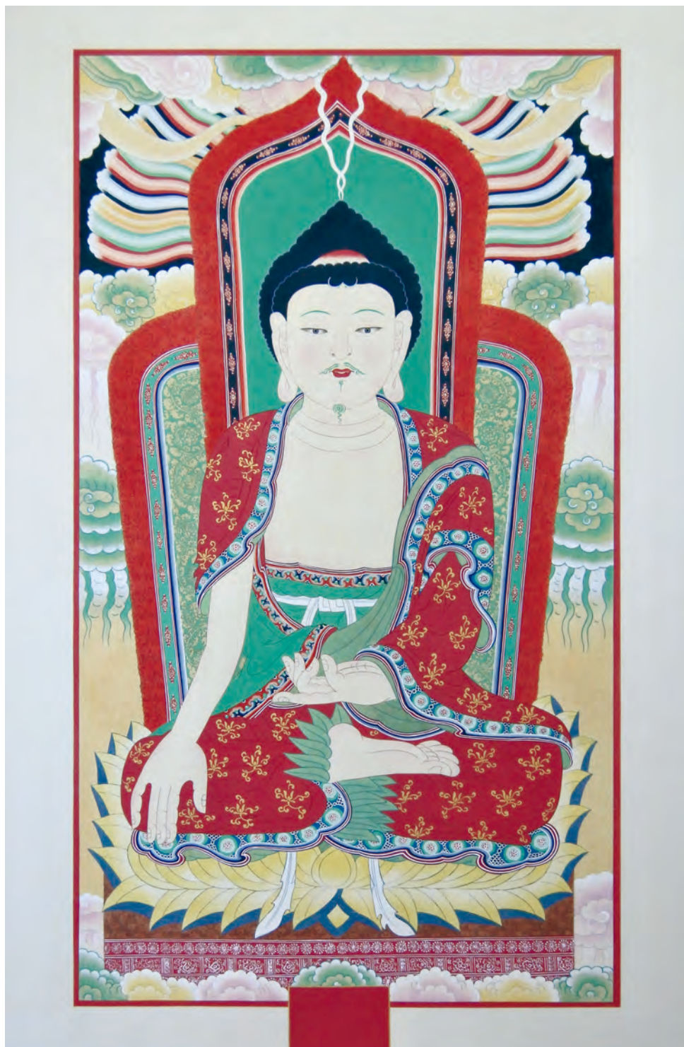
本展DM画像 《竹林寺 世尊掛仏幀(朝鮮時代1622年)復元模写》 2017年 韓紙、膠、天然岩絵具、緑青、辰砂、24金、藍、臘脂綿など H98.2×W54cm

今日の美術にあって「描く・残す」という行為が、『今という瞬間の私の想いや感性が消えてしまわないうちに、残し標す』ことに傾斜するなかで、『今を残すことが過去と未来を繋ぐ』ことに視点を据え、そこに「私」ができる範囲でひたむきに関わる朴の取り組みを見て・知ることができる本展では、「描くこと」「伝えること」が持つもうひとつの主体や本質を想うことができるのではないのでしょうか。