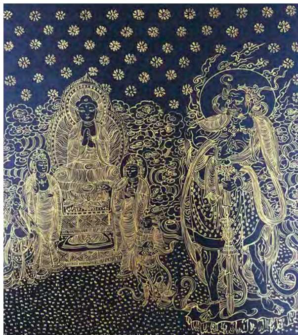
《大方廣佛華嚴經 世主妙嚴品 變相図(高麗時代1350年) 模写》部分 2017年 紺紙(美濃紙)、24金 H20×W20cm

今回の展覧会では、私が自分探しとしての「想い」を込めてきた仏画を展示致しますので是非ご観覧下さい。