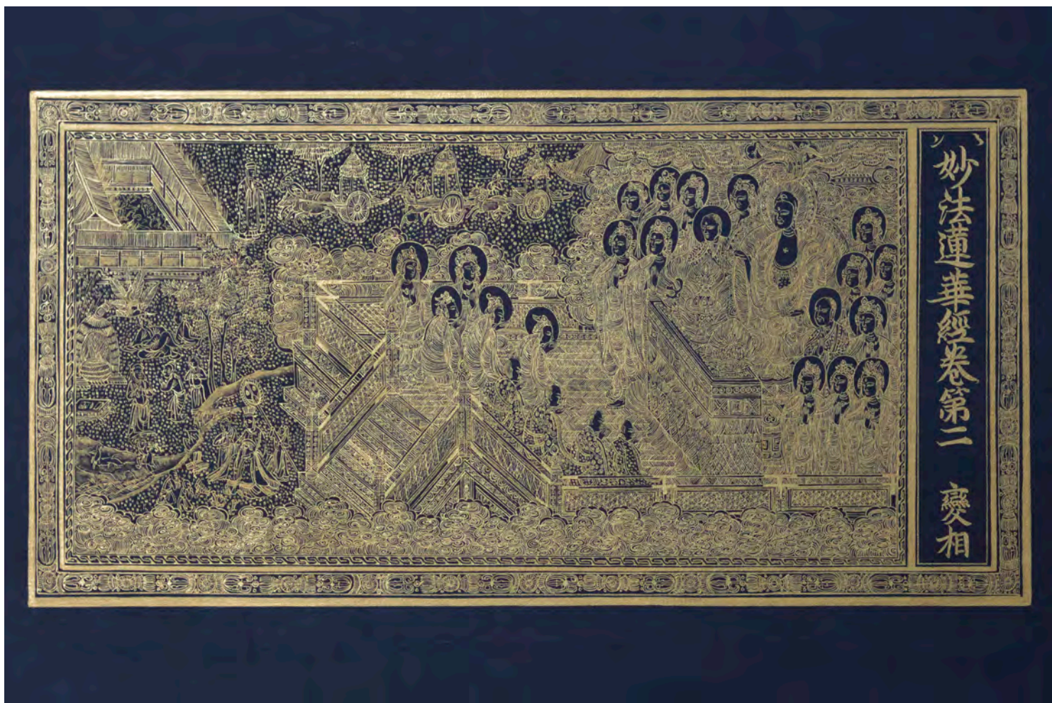
《妙法蓮華經卷第二(高麗14世紀末)模写》