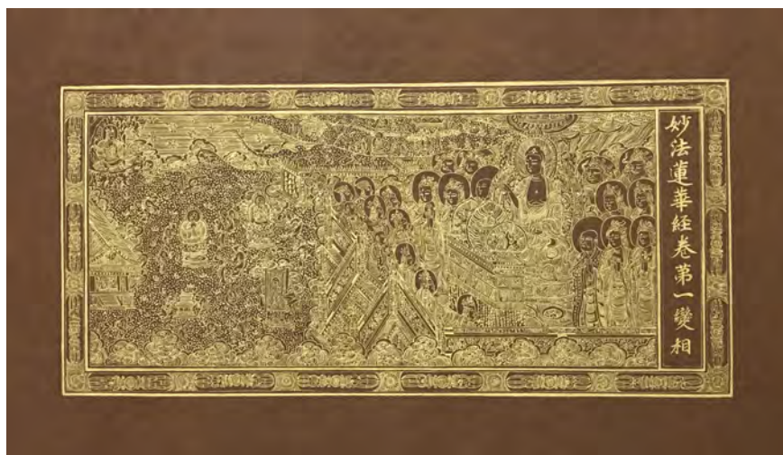
《妙法蓮華經第一 高麗時代(14世紀末) 模写》 2017年 褐紙(美濃紙)、24金 H34×W61cm