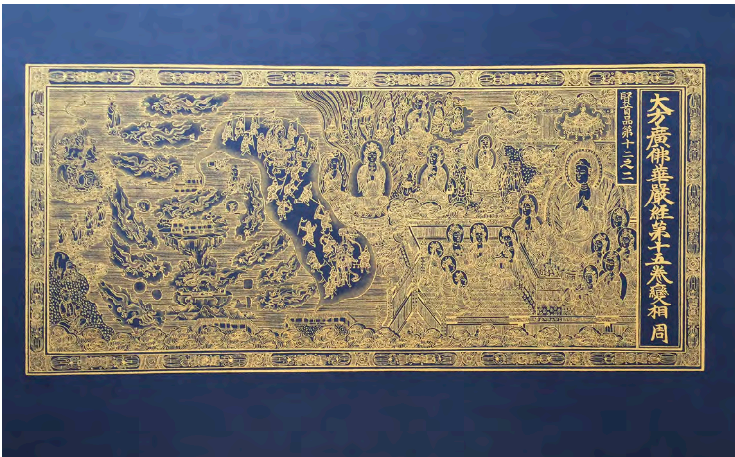
《大方広佛華嚴經卷第五十九(高麗時代1341~1367) 模写》 2013年 紺紙(美濃紙)、24金 H20×W42.5cm