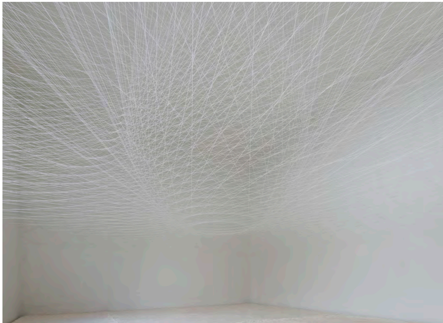
【広報画像02】『いくばくの繭』2012 『いくばくの繭』展@studio90

Gallery PARC[グランマーブル ギャラリー・パルク]では、2016年最初の展覧会として1月8日(金)から1月24日(日)まで、泉 洋平による個展「意識のスペクトル : 泉 洋平」を開催いたします。