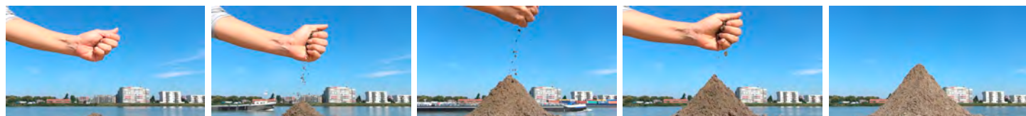
オランダに山をつくる 2014 映像 (15' 40") Video

「世界は神によって作られたが、オランダはオランダ人によって作られた。」という文を読んだ。 オランダのほとんどの土地が海抜0m以下に位置していることから、歴史的に風車や堤防などを駆使し海水と戦って自分たちの住む土地を生み出してきた。つまりこの一文は彼らの自負のようなものを表している。しかし私にとってこの文章は非常に衝撃的であった。なぜなら私は日本で育つ中で、台風や、土砂災害、地震、津波、火山噴火、雪害など、年中途絶えることのない日本の自然の脅威をDNAレベルにまで擦り込んでおり、自然をコントロールできるなどと考えたことなど一度も無かったからである。これはおそらく多くの日本人が同じであろうし、だからこそ八百万神などが私たちの古代宗教の中にはあり、私たちは山に向かって山の踊りを踊り、海に向かって海の歌を歌ってきたのだろう。 しかし、もしこの一文が示すように、オランダ人がオランダを、今まさに自分たちが立っているこの土地を、森を、川を、自らの手で作ったという意識があるのなら、それはおそらく自然に対する考え方や文化の発生の仕方、何から何まで私たちとは違うのではないだろうか、とそんなことを思った。 オランダには山が無い。だから私はオランダに山を作った。彼らにとってこの「山」はどのように映っているのだろうか