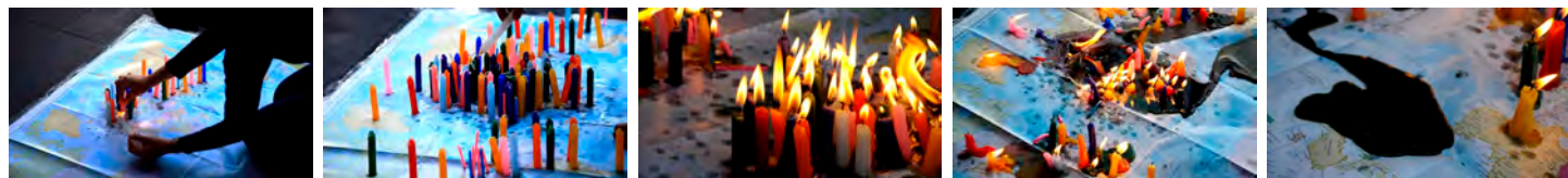
極彩色の闇 2014 映像 (55' 41") Video

1年間メキシコに住んでいたとき、彼らの文化(例えば家、伝統的衣装、民芸品、伝統的絵画など)の中に、無数の色が使われているのを見た。それらは一見、とても華やかで美しいのだが、なぜか一方で表層的にも見え、私はその無数の色の後ろに“何か黒い闇のようなもの”を感じずにはいられなかった。その理由は定かではないが、メキシコがスペインによって征服されていた時代が強く関係しているように思えた。かの有名なオクタビオ・パスが著書「孤独の迷宮」で書いているように、現代においても、様々なルーツを持ちながら彼らは「メキシコ人とは一体何か」と自分たちのアイデンティティを問い続けている。このビデオでは無数の色が落下し、混ざりあい、最初、白かった背景は黒へと変化する。使っているのは、メキシコの祝い事などに使われる紙吹雪である。