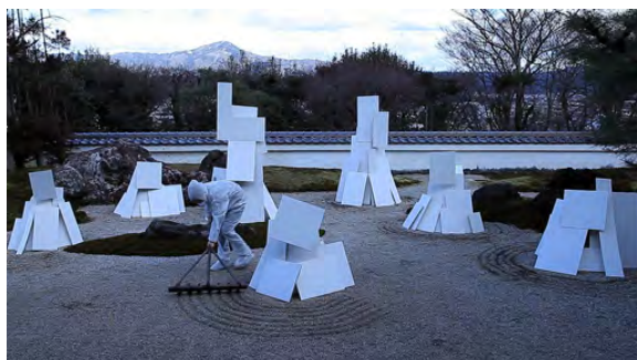
“ Unconscious ”

2015年3月3日[火] — 3月22日[日] 11:00~19:00 *月曜日休廊・金曜日20:00まで・最終日18:00まで 関連トークイベント 「対 話: 山本聖子×内山幸子」 3月15日[日] 16:30~(90分予定)