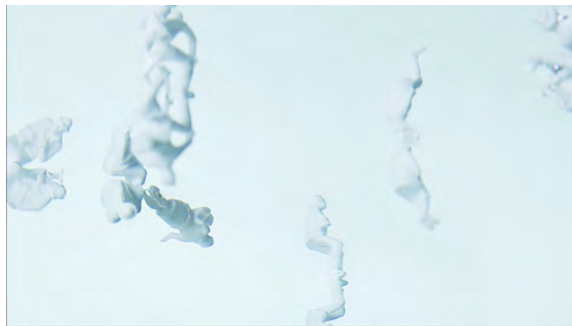
“ plastic soup ”