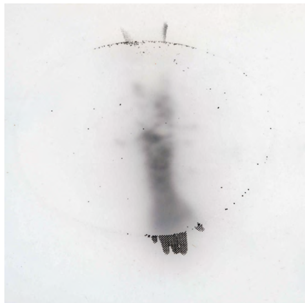
row - ude | 2009 | パラフィン板にシルクスクリーン、ロウソク、ガラス | 30.0×30.0×1.0cm

常に矛盾を抱えながら流動的でいたい自分と、立ち位置を定めたい自身が、せめぎ合うこと。