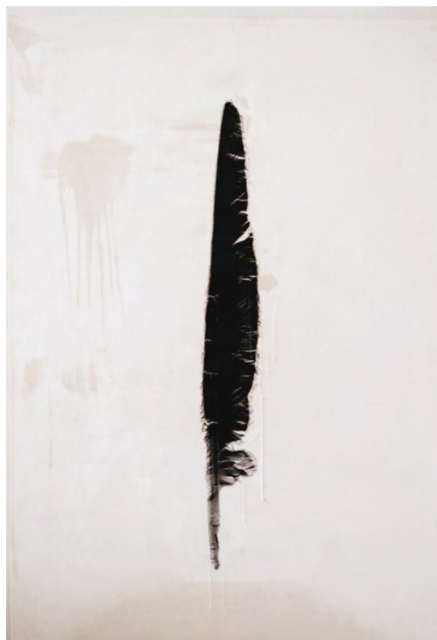
row - hane | 2012 | パラフィンを引いた紙にシルクスクリーン、バーナー | 116.5×81.5×4.0cm