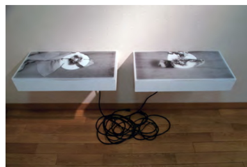
【画像08】 左| row - syatsu 右| row - kutsushita 2011 | パラフィン板にシルクスクリーン、木、鉄、電球 29.7×59.4×8.0cm