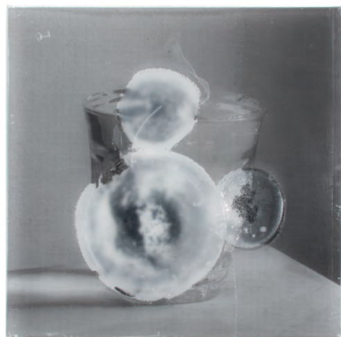
【画像06】 row - koppu| 2008 | パラフィン板にシルクスクリーン、ロウソク、ガラス 30.0×30.0×1.0cm

2012年12月1日(土) — 13日(木) 日仏会館 エントランスホール(東京)