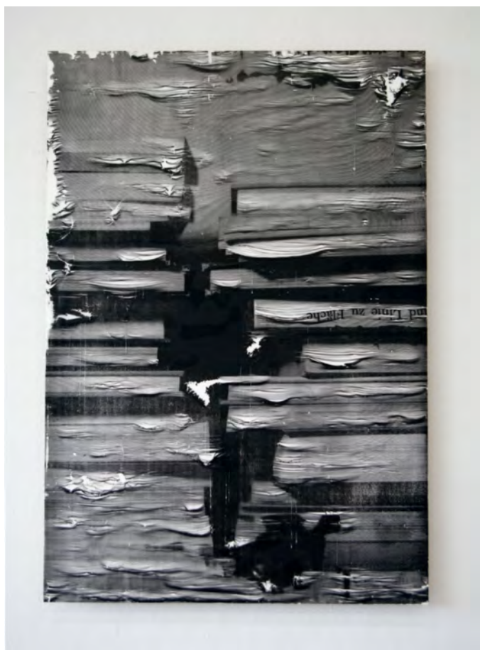
row - hon | 2012 | パラフィンを引いた紙にシルクスクリーン、バーナー | 116.5×81.5×4.0cm