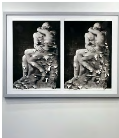
【画像07】 row - the kiss| 2011 | パラフィンを引いた紙にシルクスクリーン、バーナー 118.9×84.1×0.3cm installation view