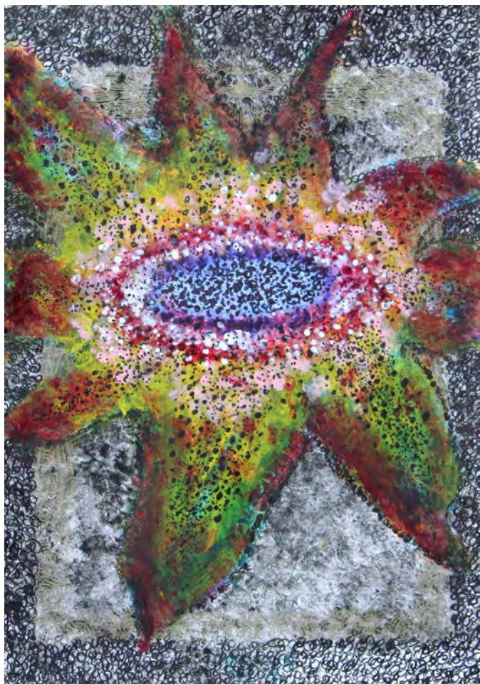
【画像02】 いんともみ作品 297×420, 水彩、ペン、賞状用紙

お問い合わせ: Gallery PARC [グランマーブル ギャラリー・パルク] (正木・永尾) 〒604-8082 京都市中京区三条通御幸町弁慶石町48 三条ありもとビル[ル・グランマーブル カフェ クラッセ] 2F 【Tel&Fax】075-231-0706 【Mail】galleryparc@grandmarble.com