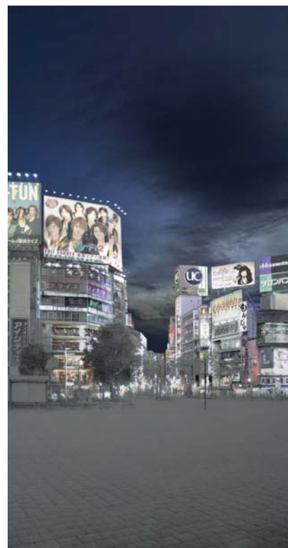
【画像a1】【画像a2】【画像a3】 Sheltering Sky video projection(pencil on panel, HD video projector, HD video), duration 110cm×210cm, 2011