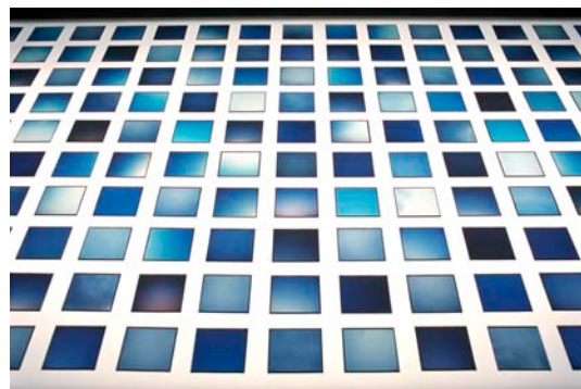
【画像c1】 LightScape/AirPiece 180 color positive films , light , 182cm×91cm , 2007