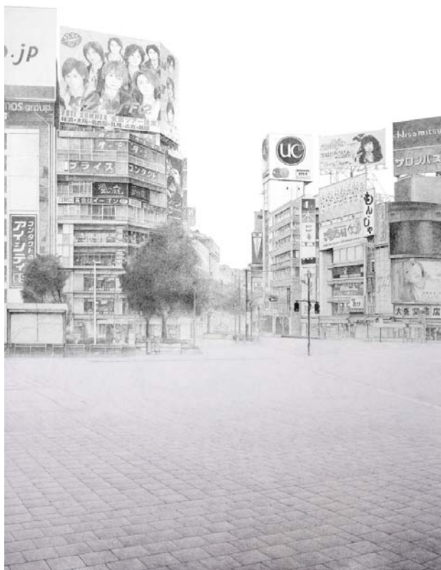
【画像a5】 Sheltering Sky video projection(pencil on panel , HD video projector , HD video) , duration 110cm×210cm , 2011