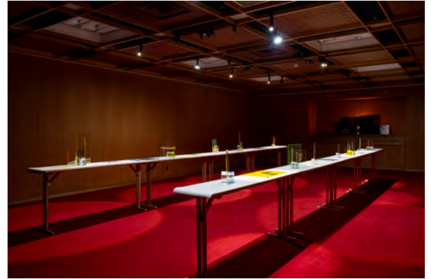
《The polyphony of our narratives》 個展「声々が灯して」(2023 尼崎市総合文化センター / 兵庫) 展示風景