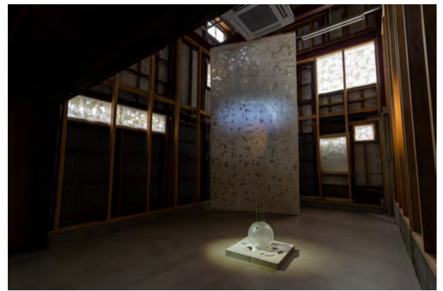
《月に日に》 個展「月に日に-with months and days/suns and moons」(2021 VOU / 京都) 展示風景