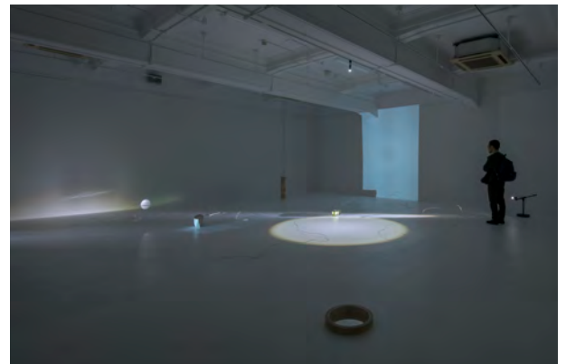
《むこう側から》 「生業・ふるまい・チューニング 小出麻代一越野潤」(2018 京都芸術センター / 京都) 展示風景