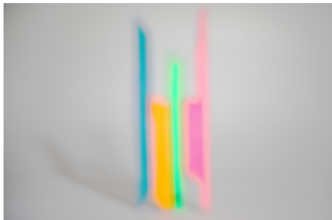
参考画像 《 blocks (light) #1 》 2013 Chromogenic print 600×900mm