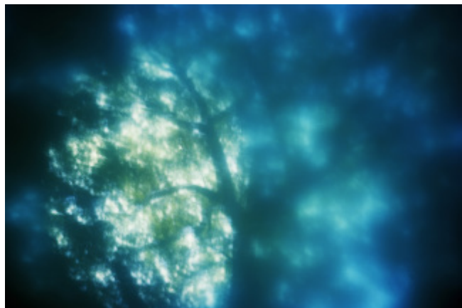
参考画像 《 GOLD SEES BLUE #1 》 2009 Chromogenic print 600×900mm (image size)