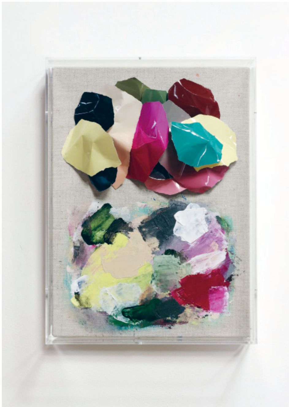
参考画像 《Picture(s) #27》 2022 Acrylic and analog chromogenic print on canvas (with acrylic frame) 343×253×68mm (frame size)