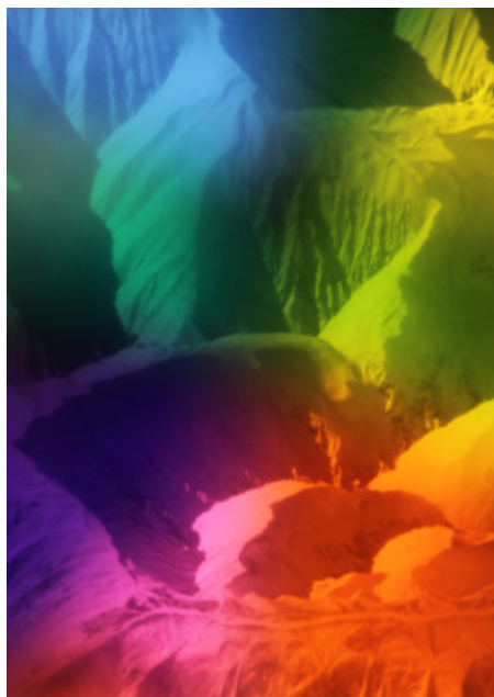
参考画像 《Land #17》 2020

Acrylic, oil and analog chromogenic print on canvas (with acrylic frame) appro× 652×500mm