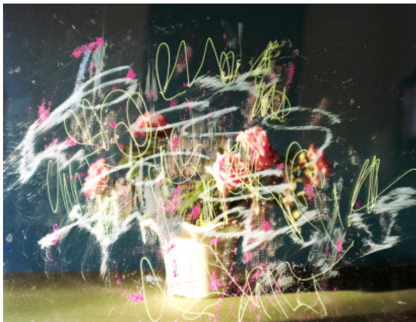
参考画像 《pLastic_fLowers II #20》 2017

Chromogenic print 457×560mm (sheet size)