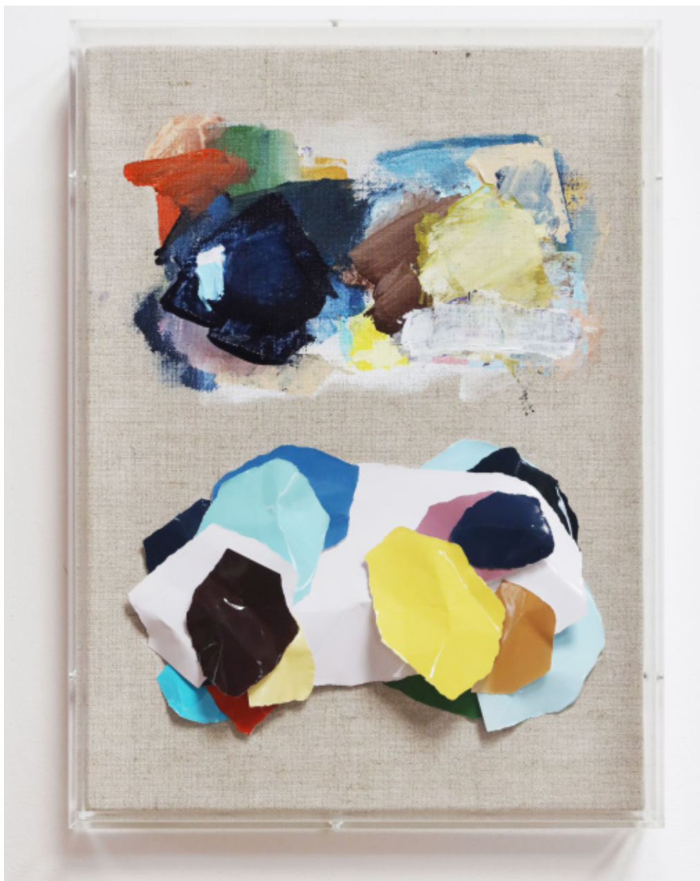
参考画像 《Picture(s) #36》 2022 Acrylic and analog chromogenic print on canvas (with acrylic frame) 343×253×68mm (frame size)