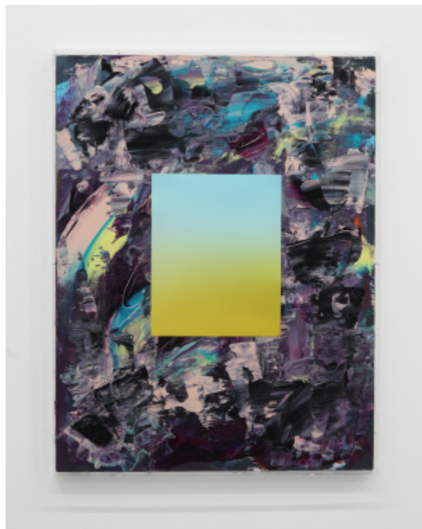
参考画像 《PP #15》 2020

主なグループ展に、2021年「Foreland」(Foreland、キャッツキル)、「Never the Same Ocean」(soda + HAGIWARA PROJECTS、東京)、「風とイメージ」(Sprout Curation、東京)、2019年「S/F -写真、あるいは、200年後のモノリス-」(KAYOKOYUKI + soda、東京)、2016年「TAMA VIVANT II 美術-あいまいなパラダイム」(多摩美術大学、東京)、2015年「NEW BALANCE #3」(XYZ collective、東京)、「hyper-materiality on photo」(G/P gallery shinonome、東京)など。